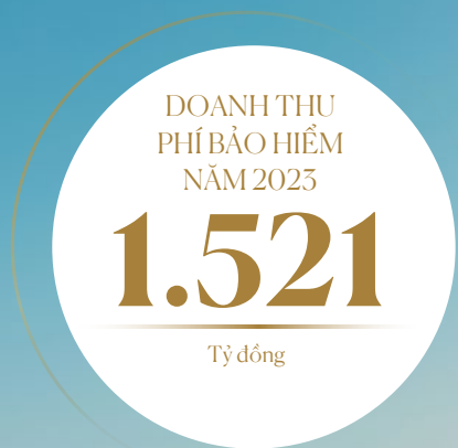
DOANH THU PHÍ BẢO HIỂM (tỷ đồng)