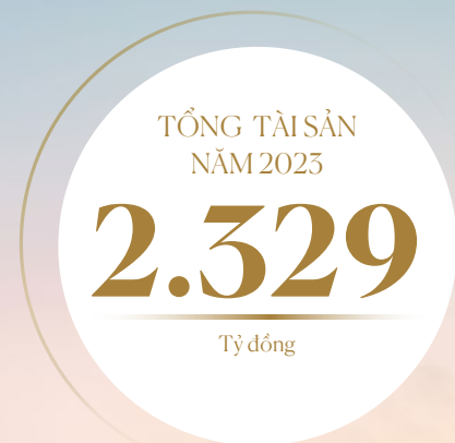
TỔNG TÀI SẢN (tỷ đồng)