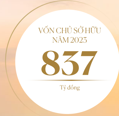
VỐN CHỦ SỞ HỮU (tỷ đồng)