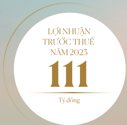
LỢI NHUẬN TRƯỚC THUẾ (tỷ đồng)